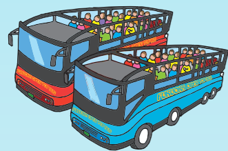
国際線 旅客ターミナルビル